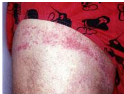
reactie op elastiek in ondergoed

De uitslag die ontstaat door contact met het thiuram wordt ook wel allergische contactdermatitis genoemd. Dit kan op vele plekken van de huid voorkomen en zich in verschillende vormen uiten.